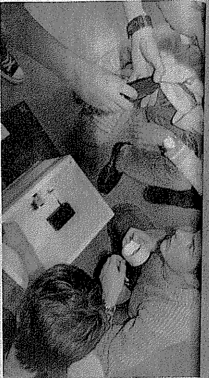
Réalisation d'instrumentation pour équiper un ballon atmosphérique lors d'une journée de formation pédagogique dans un collège.