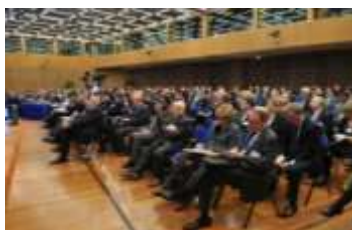
400 participants rassemblés à l'amphithéâtre Pierre Mendès France à Bercy.