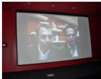
Le 17 novembre dernier : duplex en direct de la Silicon Valley